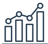
OUTIL DE RECALCUL DES VARIABLES DE GESTION