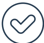
GAMMES DE CONTRÔLE